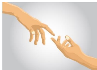
chasch di losloh