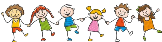
es Waldchind isch für s ander do, joooo