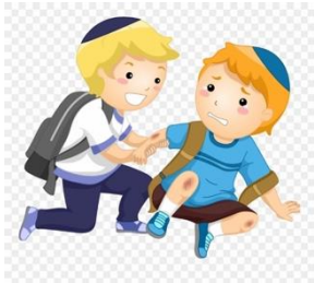
Und i hälf dir