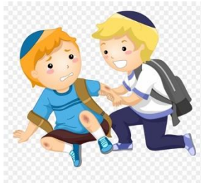
und du hälfsch mir