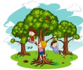
döt spieled mer