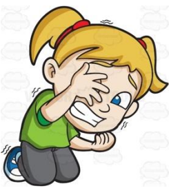
heb kei Angst